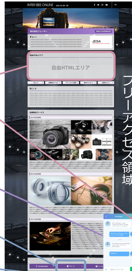
■ 出展者詳細ページ (サンプル)

(3) 問合せフォーム作成 新規作成・ページ埋め込み 4.5万円～ ※ツールを自前で設定される場合は出展費用内で設置可能です。 ※埋め込まれるツールの指定はできません。