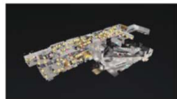
フロアプラン表示