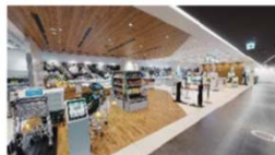
シームレスな360°ビュー