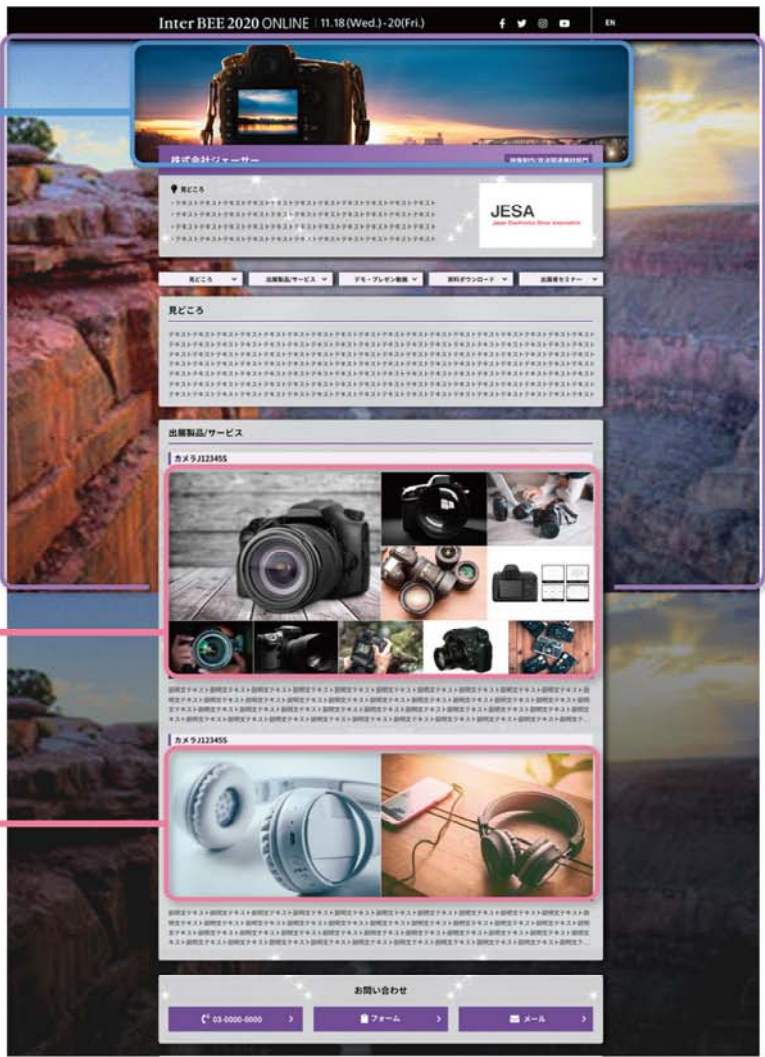
■出展者詳細ページ(サンプル)

※撮影は、デザインディレクターとカメラマン2名で行ないます。スタジオで撮影・自社で撮影等、撮影場所 や照明機材の有無、交通費など、別途お見積もりいたします。 複数の製品を同時に撮影する場合のコスト調整なども、お打ち合わせ後に別途お見積もりいたします。